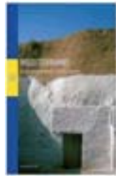
Mediterranei di Luisa Rossi