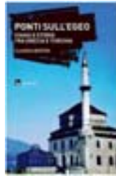
Ponti sull'Egeo di Claudia Berton