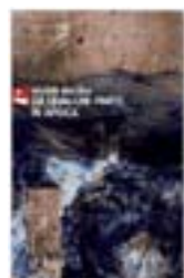
Da qualche parte in Africa di Helder Macedo