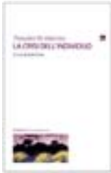
La crisi dell'individuo di T. Theodor W. Adorno